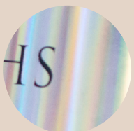
Auftragen von Hologrammen