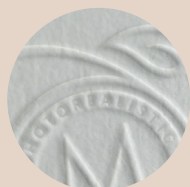
Embossing & Debossing